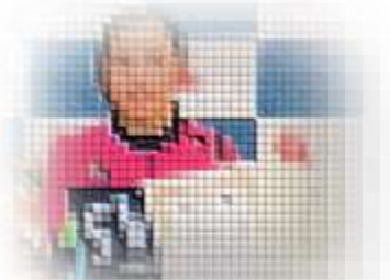
令和6年度 ニック杯争奪卓球大会 小学女子 優勝 〇-〇 〇〇 〇〇 さん (第34回勝毎杯全十勝団体卓球大会 第3位 )