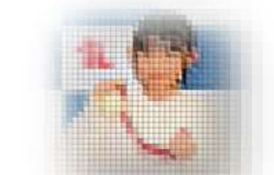
第2回 十勝ロイヤルホテルカップ 優秀選手賞 〇年〇組 〇〇 〇〇 さん