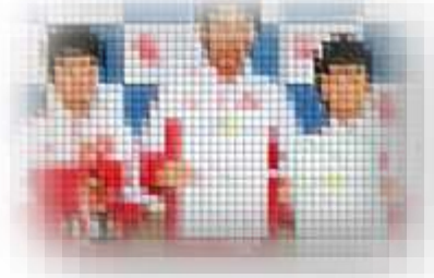
全道フットサル選手権大会2025 U-12の部十勝地区予選第2ブロック 第3位 明和広陽サッカー少年団