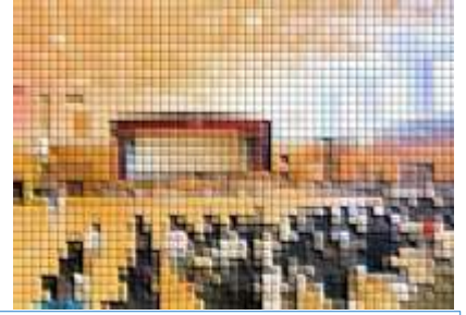
全体の様子を見ながら、上手に進行をしていました。