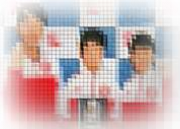
2024 とちふットサルリーグU-12 Hブロック 優勝 明和広陽サッカー少年団