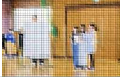
全校くさりチャレンジの報告 *各学年で折り紙製のくさりの長さを競い合いました。