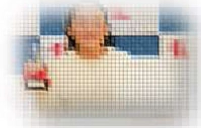
北日本チアリーディングフェスティバル 自由演技競技 小学校部門 高学年の部 第1位 帯広十勝チアリーディングチーム 〇年〇組 〇〇 〇〇さん