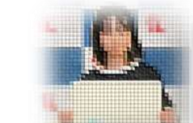
第33回しげ吉杯 全十勝小学生バレーボール大会 混合の部 第3位 〇年〇組 〇〇 〇〇さん (啓西バレーボール少年団)