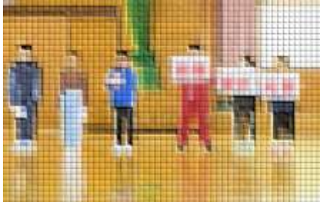
あいさつは、笑顔で、元気に、自分から

今年度、5回目となる全校集会を児童会が主体となって実施しました（奇数月毎に6回実施します）。全校児童で元気よく校歌を歌った後、児童会役員の進行で会は始まりました。各委員会が、今年度の取組の成果や今後の活動について紹介しました。全校が一堂に会する貴重な機会を大切にしながら、短い時間の中でも、『自分たちのことを、自分たちで考え、充実した学校生活を送ることができるようにする』との思いを全校で共有しました。