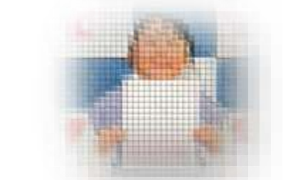
タイピング技能検定 イータイピング・マスター合格認定 4級 〇年〇組 〇〇 〇〇さん