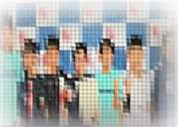
U-10 2025ニューイヤーズフェスタin浦幌 優勝 啓西バモラJr.FC